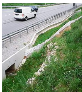
Einer der Durchlässe entlang der Weßlinger Umfahrung.

Die Zahlen der Amphibien, die auf ihrem Weg in die Laichgewässer die Umfahrung unterqueren, also die Durchlässe finden, seien schlecht, „die Quote liegt im einstelligen Bereich, müsste aber 75 Prozent betragen“, sagte Brombach. In einer Nacht seien an die 700 Tiere gezählt worden, nur 30 seien am anderen Ende herausgekommen. In vier bis sechs Wochen wanderten die Hüpfertiere, also die Jungtiere, zurück, das Staatliche Bauamt